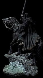
CABALLEROS DE LA OSCURIDAD