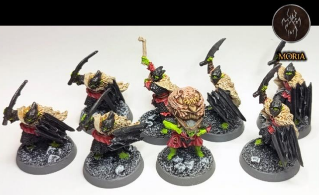
OCTUBRE 2025 - ESCUDOS NEGROS DE MORIA