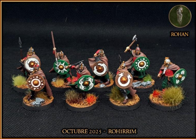
OCTUBRE 2025 – ROHIRRIM