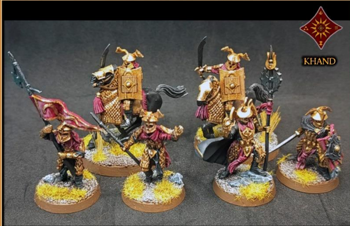
SEPTIEMBRE 2025 - RUTABI, BRÓRGIR, KATAFRACTOS Y HOMBRES DEL ESTE