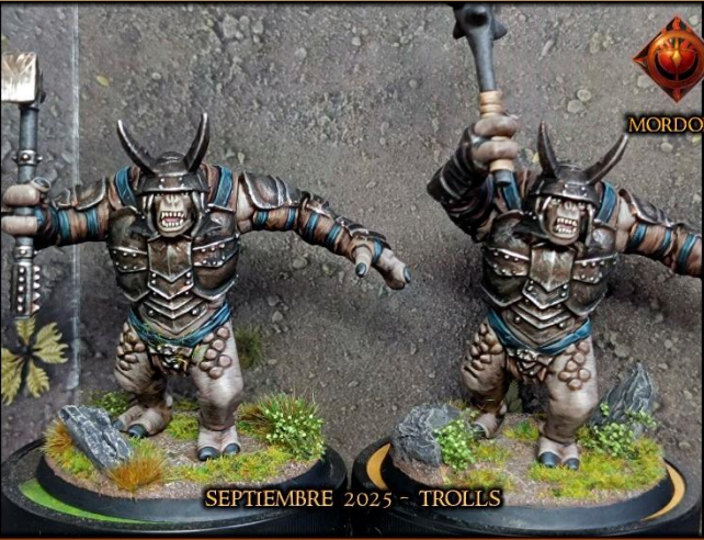
SEPTIEMBRE 2025 - TROLLS