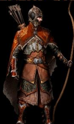
HOMBRE DE LA LUZ